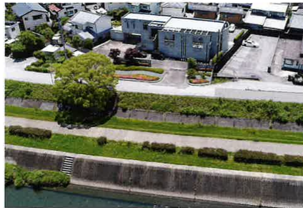
■穏やかな清流鏡川の辺りに建つ本社社屋