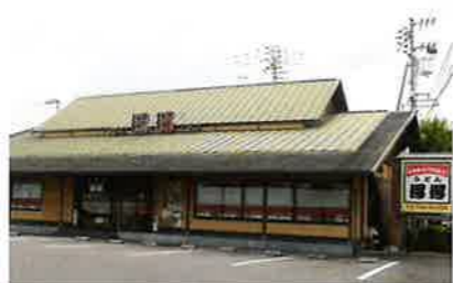
得得 高須店 高知市高須 997-1 TEL.088-882-0003