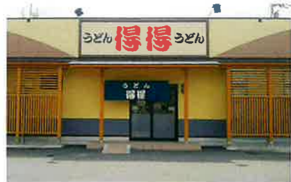
得得 安芸矢ノ丸店 安芸市矢ノ丸 2-722 TEL.0887-32-0820