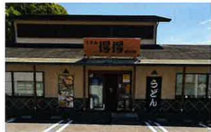
得得 高知北店 高知市東楽泉寺 120-1 TEL.088-845-3600