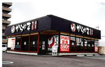
からやま 高知潮江店 高知県高知市北新田町 18-28 TEL.088-833-0120 営 / 10:30 ~ 23:00(ラストオーダー 22:30)

ゴマとニンニクが香る 旨み際立つ「極ダレ」 秘伝の「特製漬け込みダレ」と ともに愛され続けるゴマとニン ニクがベースのからあげにかけ る「極ダレ」。力強く深い味わい が忘れられなくなる逸品です。