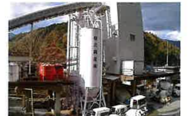
嶺北興産株式会社