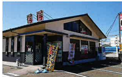
得得 高知旭店 高知市本宮町 226 TEL.088-828-8388