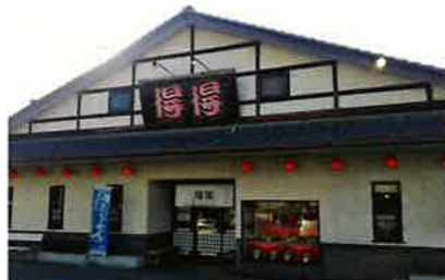
得得 東予店 西条市三津屋南 6-19 TEL.0898-64-3544