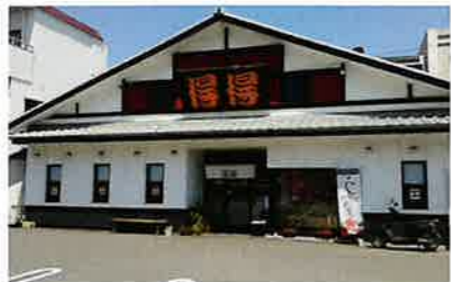
得得 今治店 今治市恵美須町 2丁目 4-1 TEL.0898-22-6677