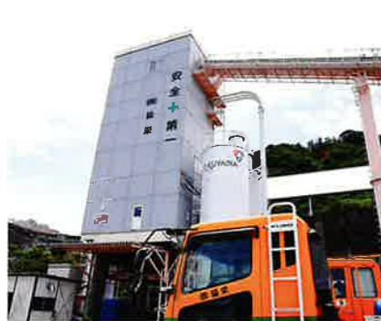
■プラント内で練り混ぜる