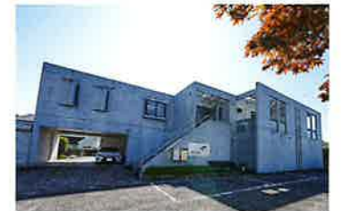
株式会社 オーシャンコンクリート 大日生コンクリート株式会社 南国生コンクリート株式会社 株式会社 高知アソウ 株式会社 高知骨材センター 株式会社 栗田フードビジネス

清水コンクリートサービス株式会社 高知県土佐清水市下益野1201 TEL.0880-85-0727 / FAX.0880-85-0082