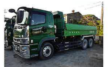
有限会社 岡崎建販