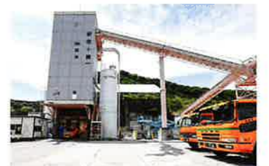
株式会社 協栄南国工場