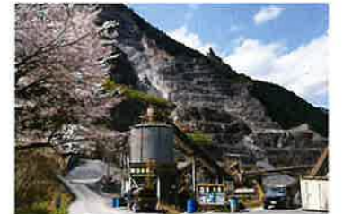
越知砕石株式会社